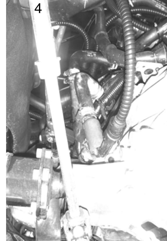
Värmare med slangar monterad. Heater with hoses, mounted. Motorvorwärmer mit montierten Schläuchen.